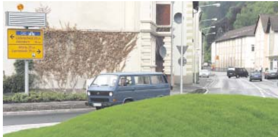
Wer dem Wegweiser am Kreisverkehr Untertor folgt, fährt in Richtung Altena und Lennestadt über die Bahnhofstraße – das ist allerdings nicht gewollt.